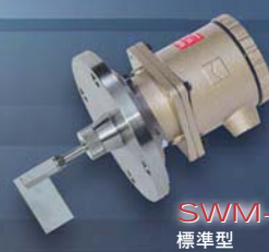
SWM-8B (SU3) 標準型